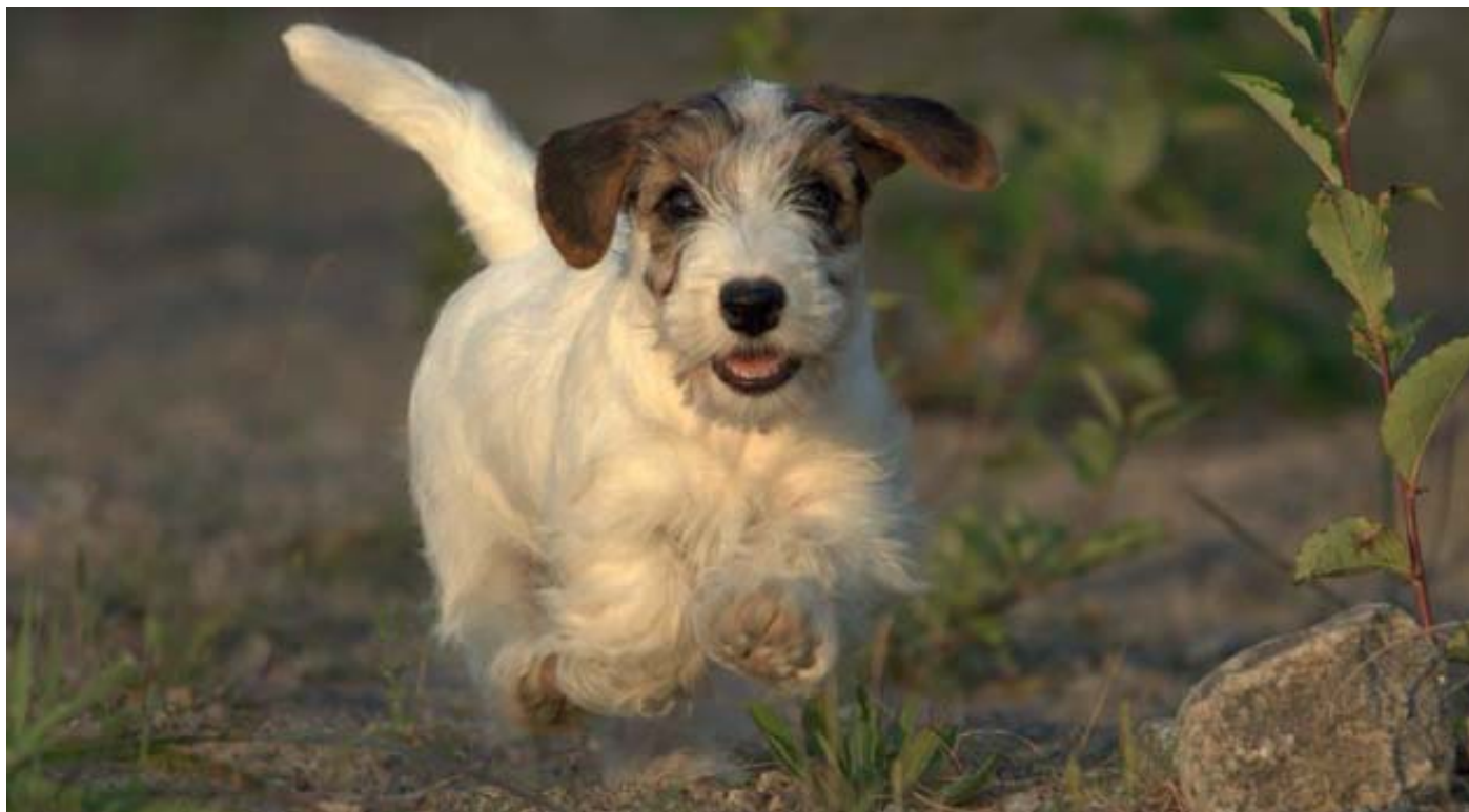
Full fart framåt på korta ben.

Sealyhamterrier kräver en regelbunden kamning och borstning för att ta bort lösa hår och att förhindra pälsen att bli glanslös. Den skall trimmas regelbundet men det kan vara svårt idag att hitta yrkesmässig kompetens. Scandinavian Sealyham Society anordnar emellanåt trimkurser med kunnig ledning och det har varit uppskattade aktiviteter. Det är ju alltid roligare och mer stimulerande att lära sig saker i grupp. Sealyhampälsar kan ha olika beskaffenhet med varierande mängd underull. Det kan vara mödan värt att få sin hund korrekt trimmad då detta krävs för att den ska få det rätta rastypiska utseendet. Har man tänkt ställa ut sin Sealyham är det av högsta vikt att pälsen är noggrant trimmad och skött då detta betyder mycket för helhetsintrycket och kan vara avgörande för resultatet i utställningsringen.