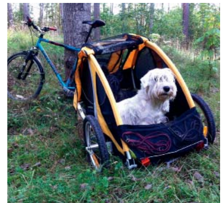
På bekväm utflykt.