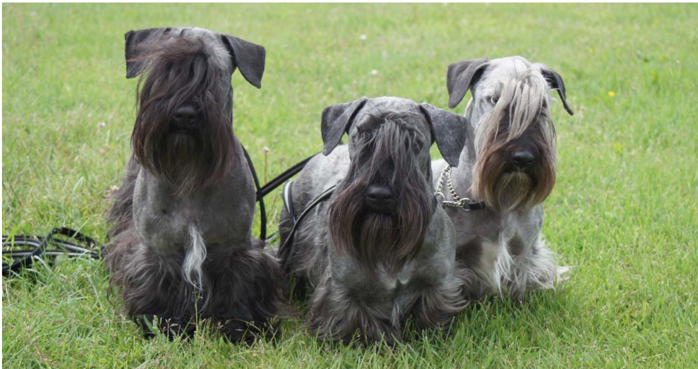
För en godbit står eller sitter man gärna fint.

som jakthund. Den mjuka långa pälsen var inte lämplig för långa dagar i skog och gryt. Många ansåg också att de få ceskyterrier som fanns, var för värdefulla för att användas i jakt. Ceskyterriern hade vid det här laget redan visat sig vara en lojal och trevlig familjehund. Den var också intressant som utställningshund.