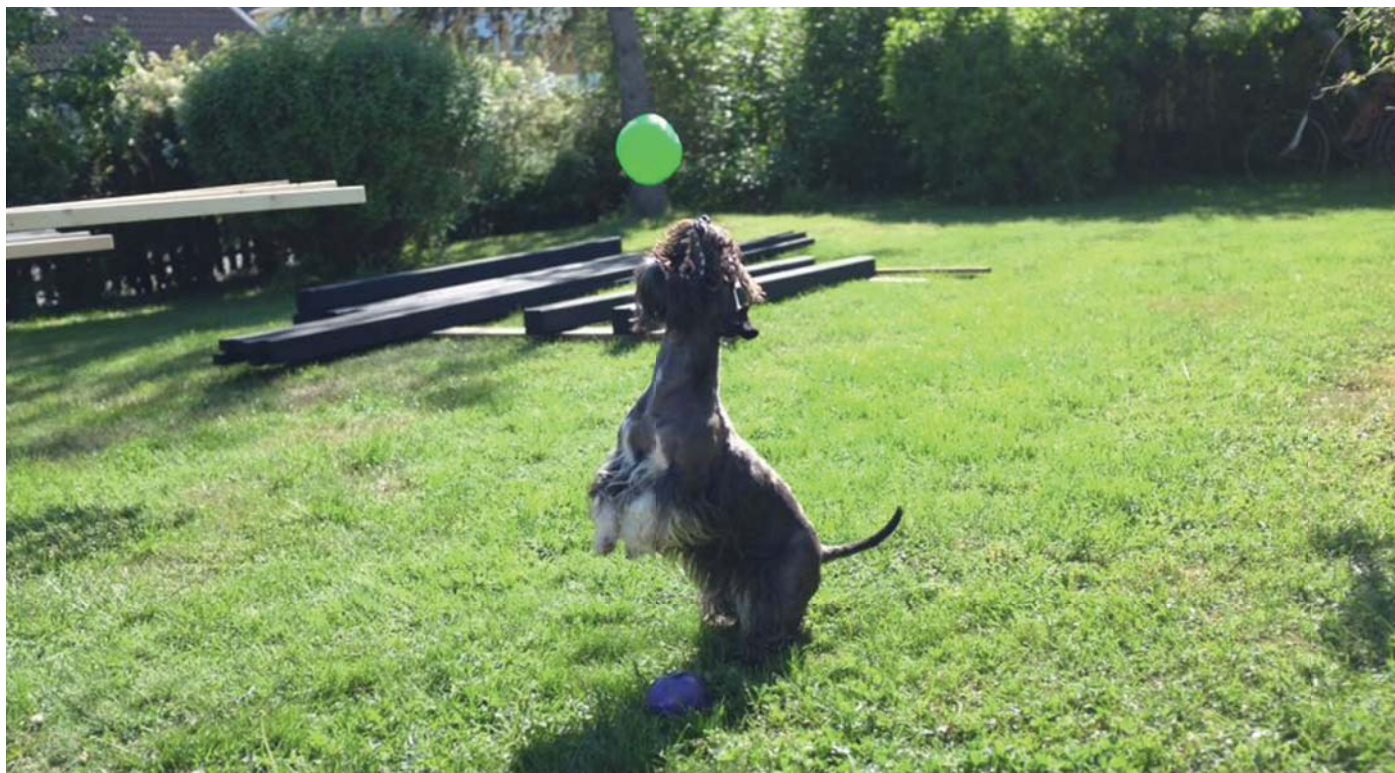
Ceskyn deltar med glädje i arbete och lek med familjen.

fäller. Den är mjuk och behaglig att ta i, och en är välskött päls blir vacker med en härlig lyster.