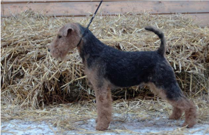
Ungdomsfoto av CH HotRiot's Lapdog

Birgitta är också en av de ytterst få som använder sina hundar i praktisk jakt.