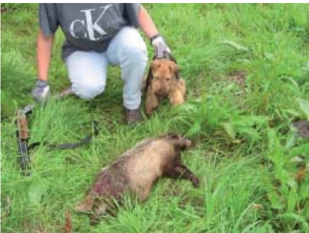
Hot Riot's Rikitikitavi.(Ricki)

Av svenska kennlar med vinstrika hundar och flera champions på agendan måste även nämnas Gorms, Touchstone, Cymrae, Vacker Tass, Aden. Kahlu'a och Min Finaste. De ska samtliga ha ett förtjänstfullt hedersnämmande. Av nutida kennlar av större betydelse i våra grannländer kan nämnas Borchorst i Danmark, Ecco's i Norge och Vicway i Finland