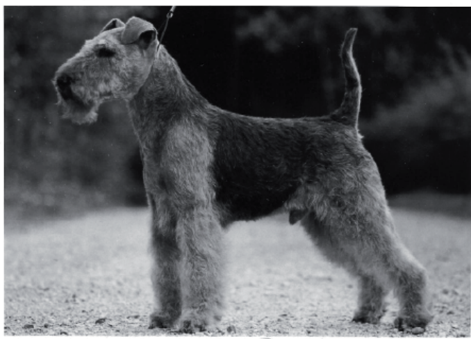
CH Dimwitch Fire Demon

Till detta kan läggas topplaceringar på Årets Welsh samt ett flertal championat. 2010 blev årets vinstrikaste svenskuppfödda welshterrier Sallygårdens Zara Moon, som är fallen efter Ch Welsas Super Trouper och undan Ch Sallygårdens Nina Ricci. Både Future Kids kennel och Sallygårdens kennel har byggt upp sitt nutida avelsmaterial på stamtikar som kommer från kennel Dimwitch, vilken i sin tur startat upp med hundar från Lars Adenheimer och det var CH Adens For Export Only, som blev kennelns stamtik, hon är förresten en helsyster till den mycket framgångsrika Int CH Adens Fit For Fight, som hade ett otal BIS och grupplaceringar i Sverige, han såldes sedermera till Australien där han var mycket framgångsrik både i utställningsringarna och som avelshund.