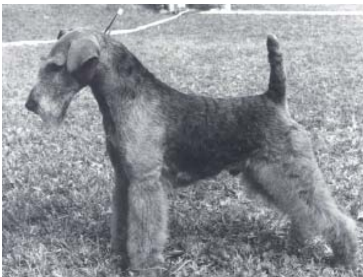
CH Vanitas New Generation

Liselotte bedriver ingen uppfödning idag. Hon är numera sysselsatt som utställningsdomare och har ett välbesökt trim i Göteborg. Mattar och hussar reser av naturliga skäl långväga för att få sina hundar trimmade hos Liselotte, för då får de det gjort efter konstens alla regler.