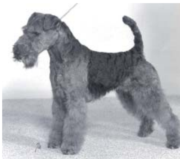
Welsas Hey I'm Hot News, efter Purston hot as hell Fadern Vanitas New Generation