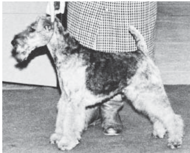
CH Laroc Night Nurse