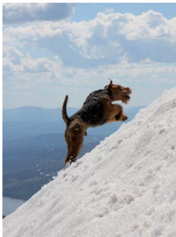
Härliga welshbilder