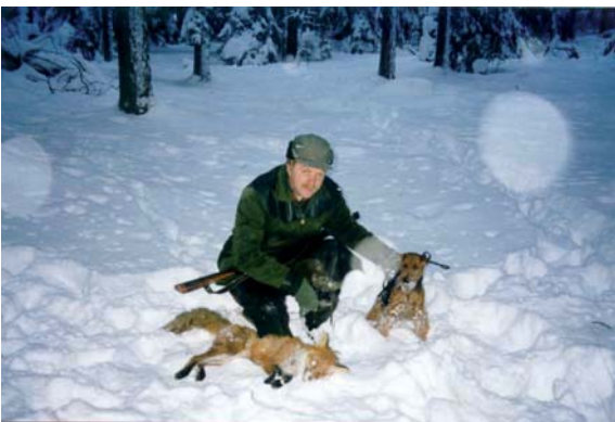
Hot Riot's Up to Date(Chili)