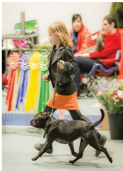
Barn med hund.