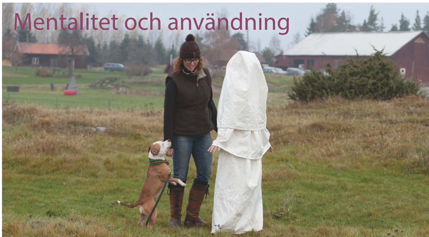
Möte med spöket.