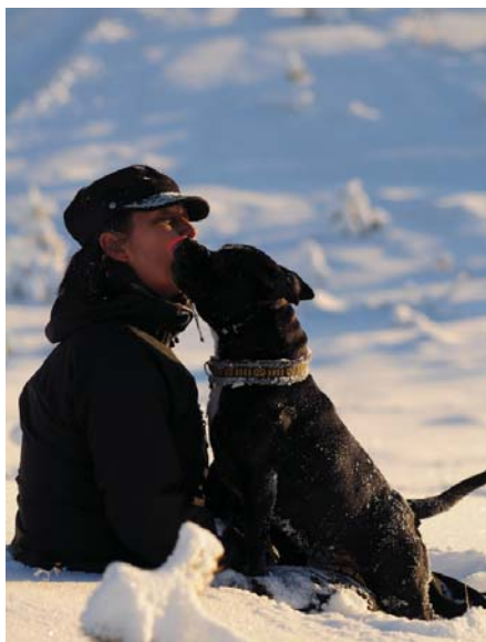
Sällskap i snön.