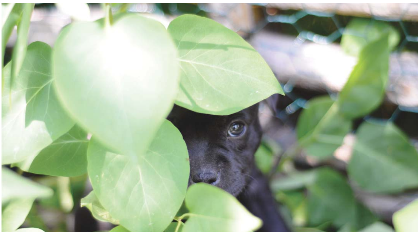
Bakom bladen.

att majoriteten av hundägarna upplevde sina hundar som vänliga, framförallt mot människor. Se sammanställningar i Bild A.