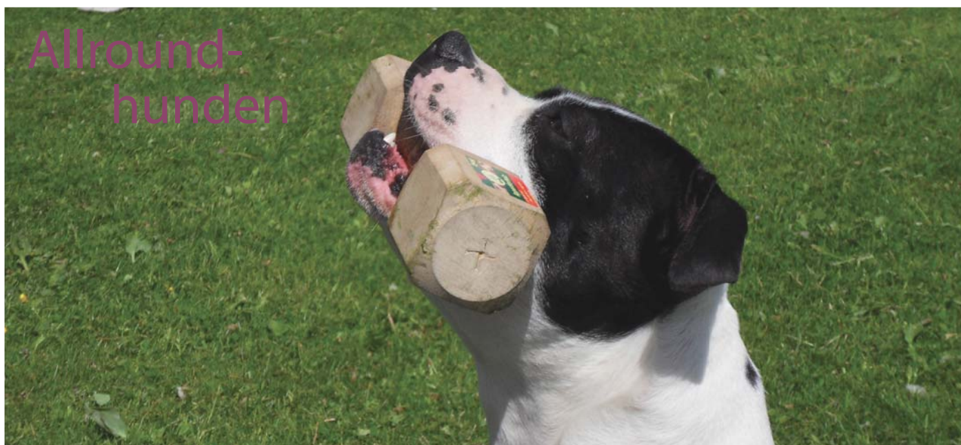
De senaste åren har intresset för lydnad med staffordshire bullterrier ökat.

Staffen är en bra allroundhund! Det är roligt att många har fått upp ögonen för att träna och tävla med sina staffar, vi ser dem nu i de flesta "grenar". Allt från bruks och lydnad, till agility och freestyle!