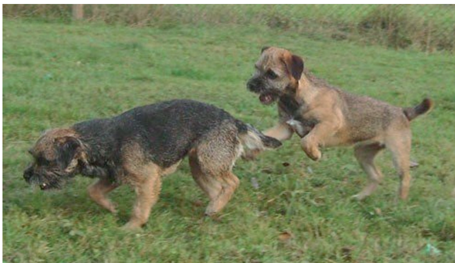
Skrållan är fortsatt rörlig trots att höftkulan opererats bort helt.